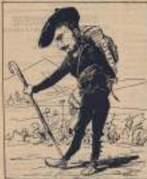
Ne doutez point, il est de ceux qui ont déjà vu par là devant.