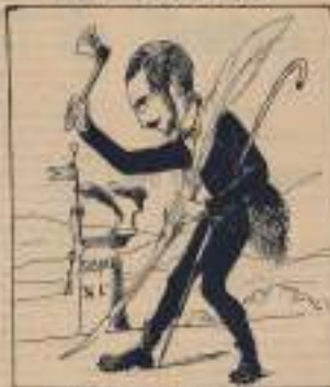
Attention général sur les bords, attention à la Rivière des grands défilés.