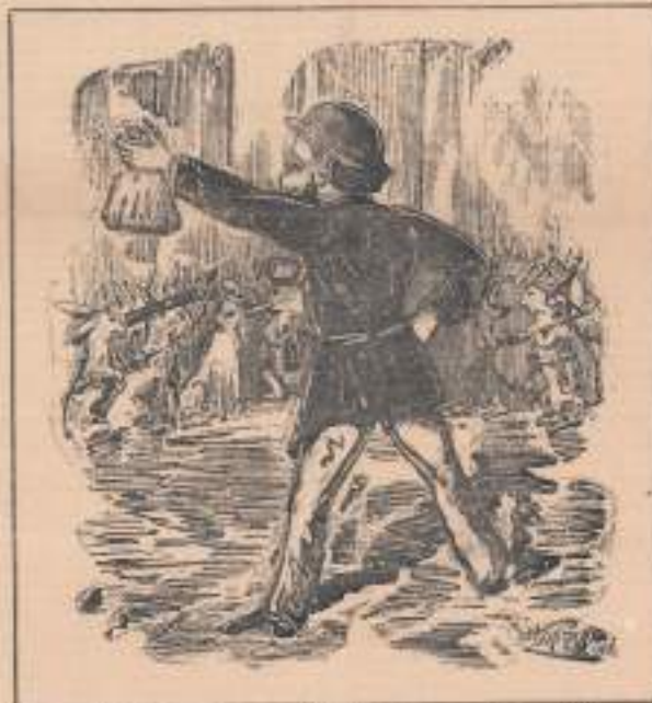
Un Nicaï qui se promène au bord de la mer (Dessiné par Louis Bachelier)