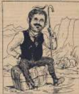
Il est si sûr comme il est sûr, surtout que il est de l'indivisible la colonne des Pionniers de Singapour.