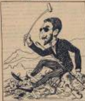
Prenez de lui garde car il est à la tête de la colonne de nos soldats.